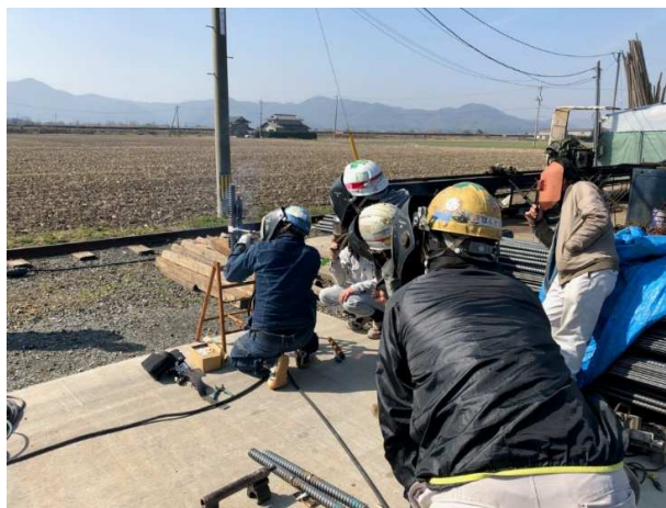
写真二 参加者が横向き溶接を行っています。 SD490 D41ネジ鉄筋を溶接