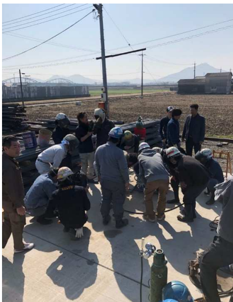
写真一 講師が下向き溶接を行っています。 SD490 D41ネジ鉄筋を溶接