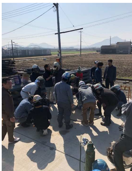
写真一 講師が下向き溶接を行っています。 SD490 D41ネジ鉄筋を溶接