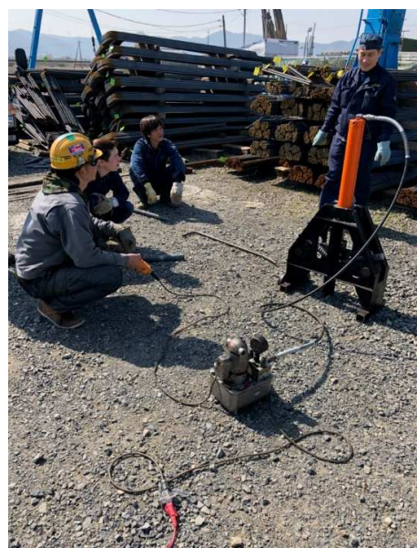
写真四 溶接した鉄筋で曲げ試験を行っています。 SD490 D41ネジ鉄筋