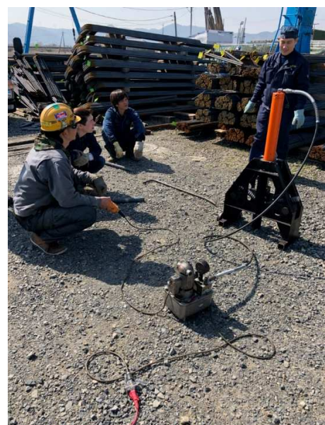
写真四 溶接した鉄筋で曲げ試験を行っています。 SD490 D41ネジ鉄筋